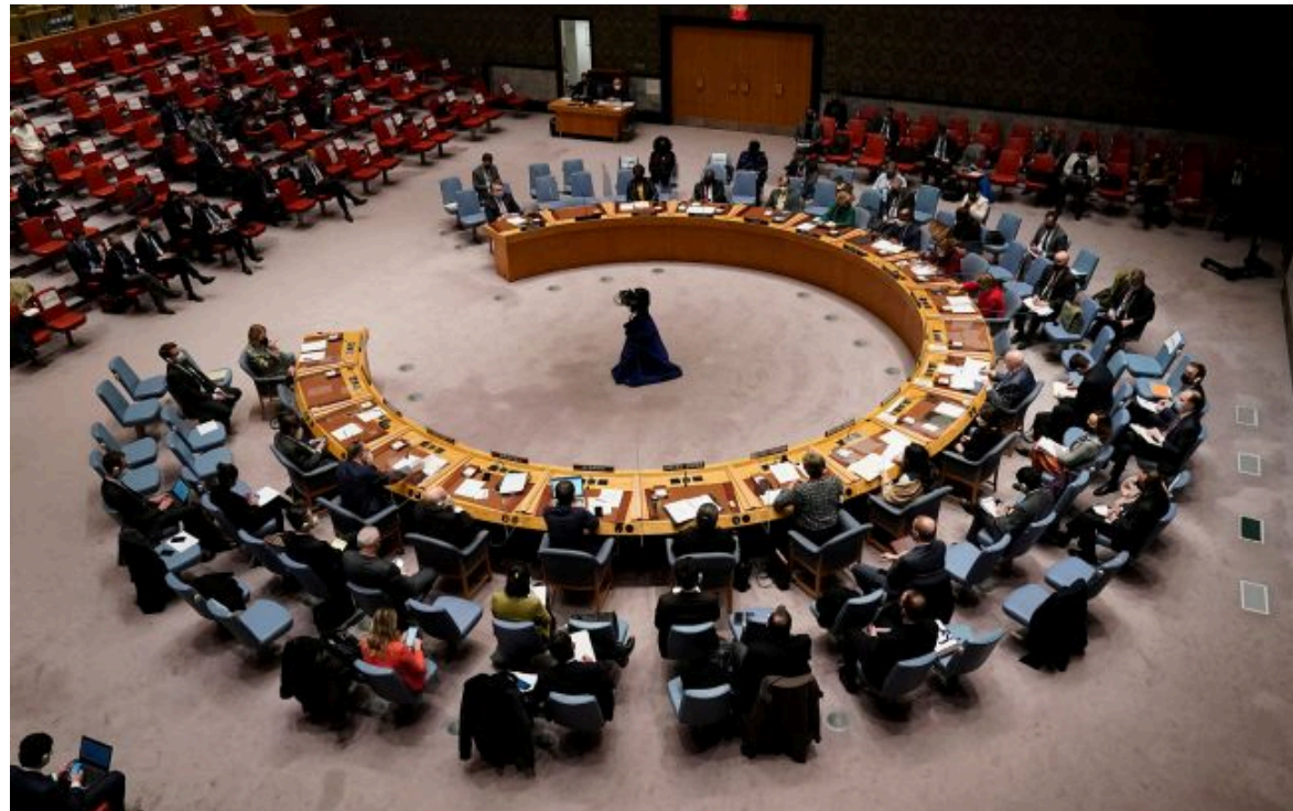
Фото: міжнародний тиск на РФ, як і раніше, необхідний