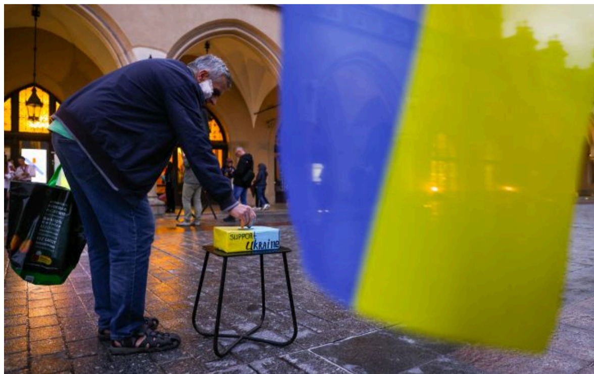
Фото: українські біженці (Gettyimages)