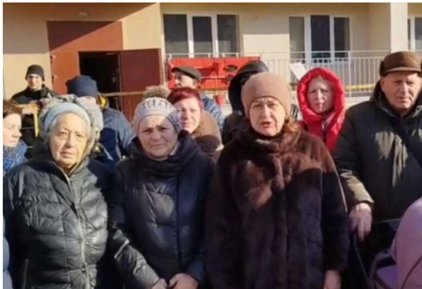
Жителі окупованого Маріуполя знову звернулися зі скаргою до Путіна: "Люди хочуть додому!"

Жителі окупованого Маріуполя в Донецькій області звернулися до президента РФ Володимира Путіна зі скаргою у зв'язку з тим, що їх виселили з дому, де вже три роки триває ремонт.