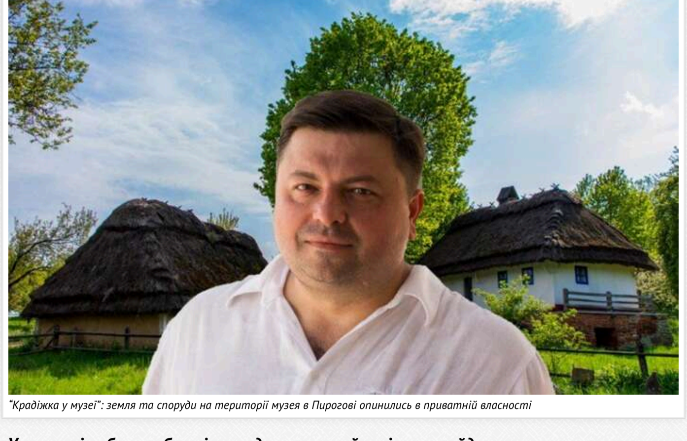
“Крадіжка у музеї”: земля та споруди на території музею в Пирогові опинились в приватній власності

У столиці набраве обертів скандал навколо імовірного рейдерського захоплення земельної ділянки площею 1,78 га на території музею в Пирогові, а також розташованих на ньому об'єктів нерухомості.