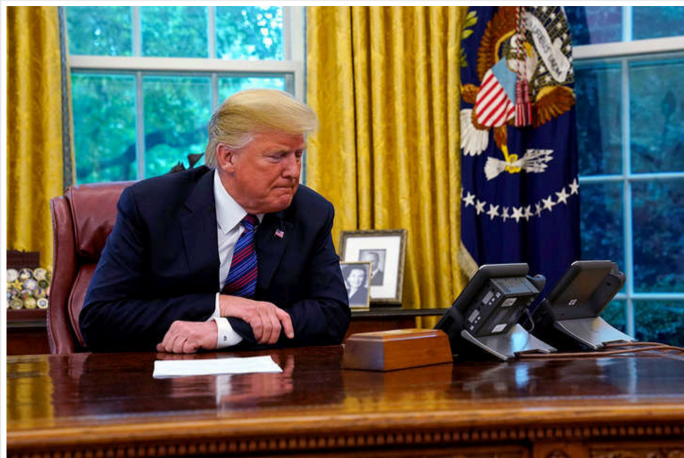
Журналіст NYT пояснив, у чому схожість Трампа при владі з "раннім" Путіним

Адміністрація США 25 лютого заявила, що сама визначатиме, кого з журналістів включати до президентського пулу, хоча раніше це робила незалежна Асоціація кореспондентів у Білому домі. Американська журналістська спільнота із занепокоєнням відреагувала на цю зміну, деякі почали порівнювати методи Дональда Трампа з тими, що застосовував диктатор Володимир Путін у Росії.