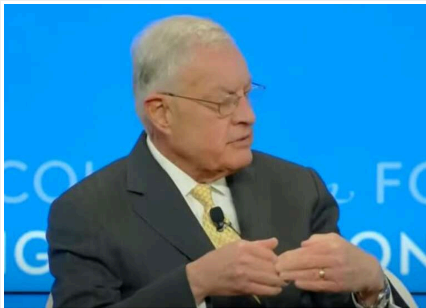
Спецпредставник США Келлог: Україна сама винна в обмеженні доступу до розвідданих

Спецпредставник США по Україні Келлог заявив, що Україна несе відповідальність за обмеження доступу до розвідувальних даних і припинення підтримки з боку США.