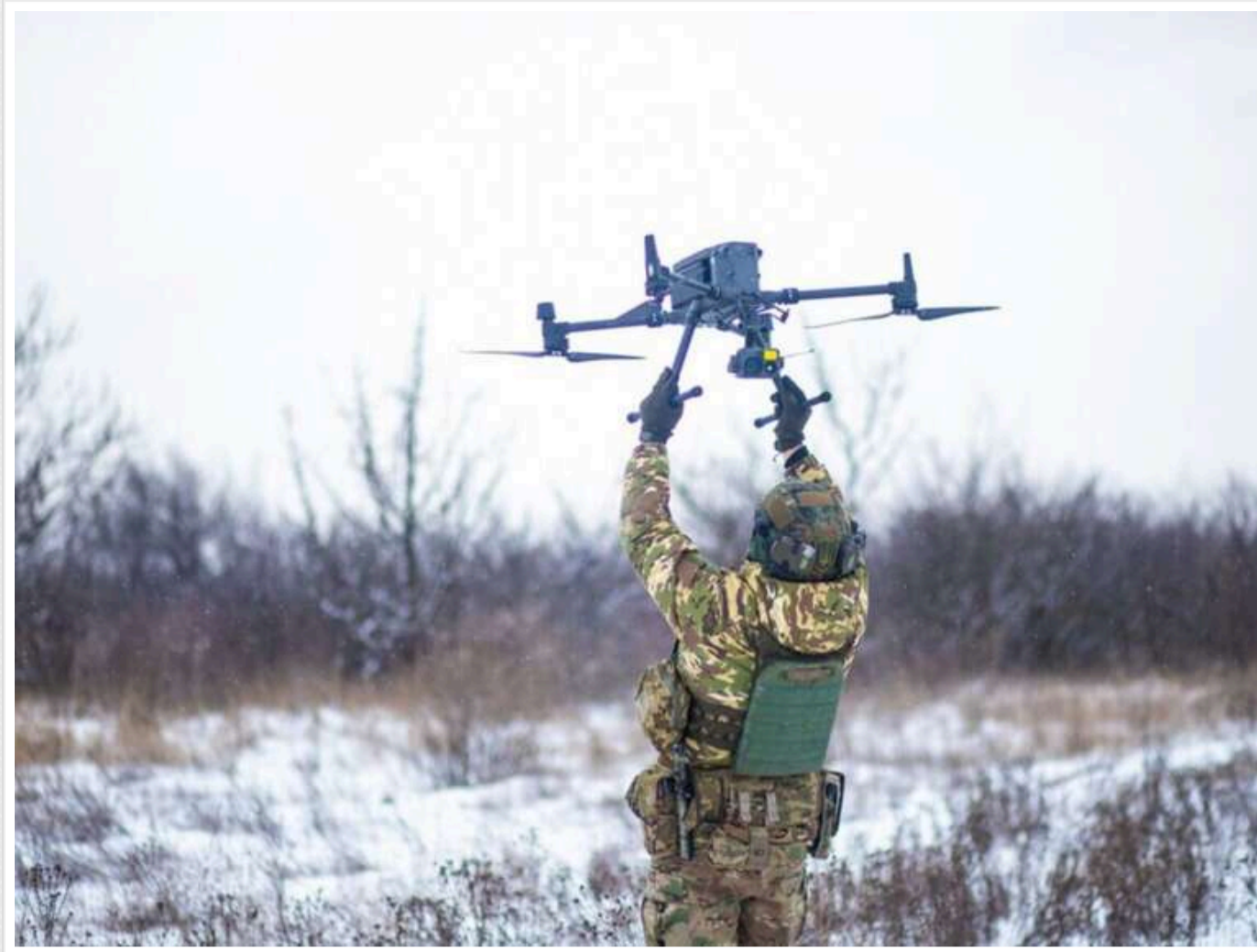
Зупинка обміну розвідувальними даними США завдасть серйозного удару по Україні. - The Spectator

Припинення обміну розвідувальними даними за ініціативою Трампа стане серйозним ударом для України, зазначає оглядач Марк Галеотті у журналі The Spectator.