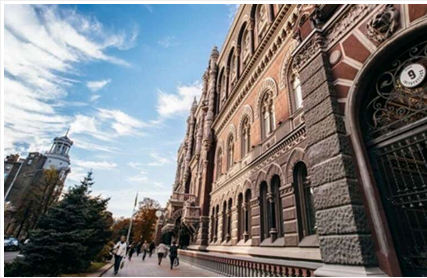
НБУ підняв облікову ставку до 15,5% через зростання інфляції та ризиків для економіки

Нацбанк збільшив облікову ставку на 1% через підвищення інфляції та вказав на основні ризики для економіки України.