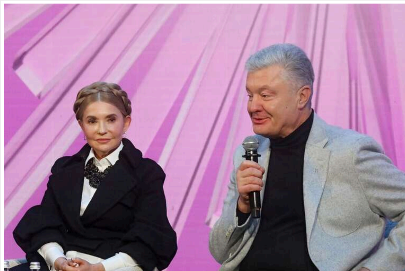
Тимошенко і Порошенко підтвердили, що спілкуються з командою Трампа

Колишній прем'єр-міністр України Юлія Тимошенко і колишній президент Петро Порошенко підтвердили, що ведуть переговори з командою президента США Дональда Трампа з ряду питань.