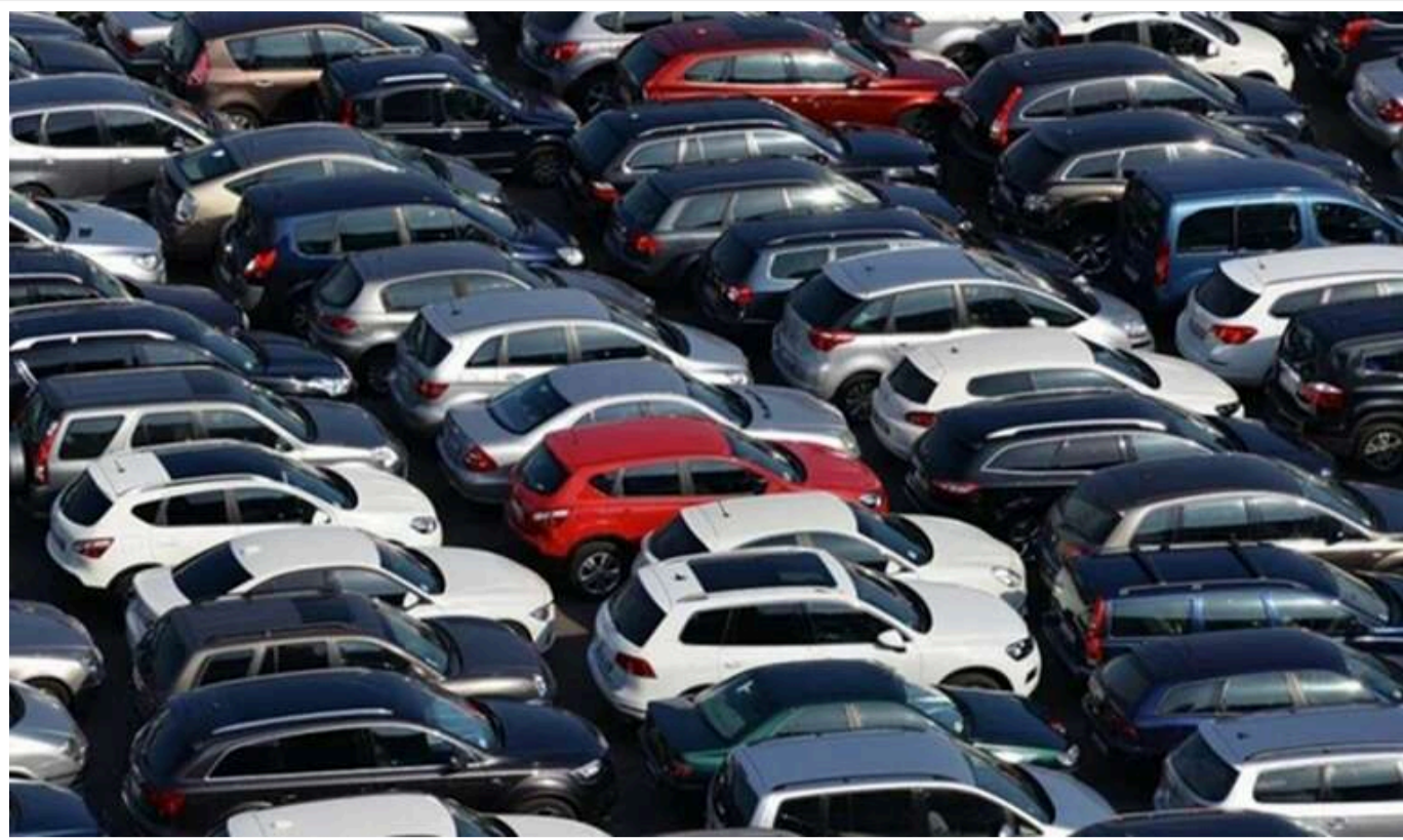
Нові мита Трампа підвищать ціни на авто в США на 25%

Торгова група, яка представляє майже всіх найбільших автовиробників, попередила, що нові тарифи в розмірі 25% на імпорט з Канади та Мексики, запроваджені президентом США Дональдом Трампом, призведуть до різкого зростання цін на автомобілі.