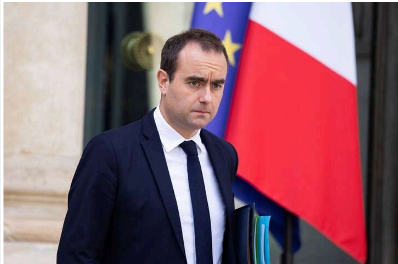
Лекорню: Франція може допомогти Україні з розвідданими

Франція пропонує розвідувальну допомогу Україні після рішення США призупинити обмін розвідданими. Міністр оборони країни Себастьян Лекорню запевнив, що Париж готовий надавати Києву необхідну інформацію.