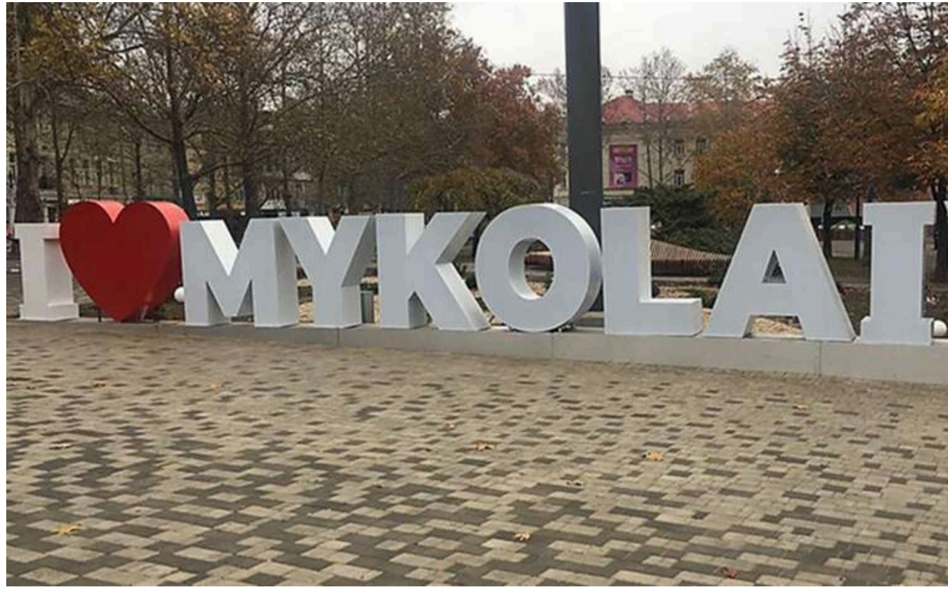
«Абонементи» для бізнесу від Дениса Мельниченка: як у Миколаєві заробляють на схемах

Миколаївська область, схоже, перетворилася на експериментальний майданчик для посадовців, які замість підтримки регіону створюють схеми тиску на бізнес.