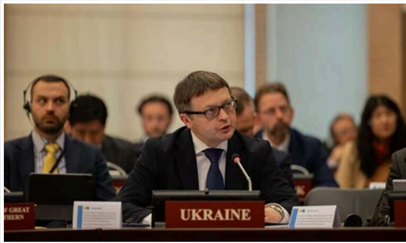
Україна в Гаазі представила докази застосування Росією хімічної зброї

Українська делегація виступила на засіданні Організації із заборони хімічної зброї (ОЗХЗ). Під час виступу були представлені докази порушення Росією Конвенції про заборону хімічної зброї.