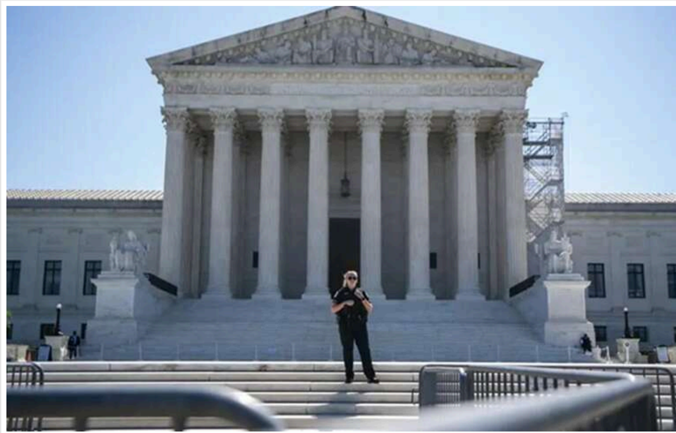
Верховний суд США зобов'язав Трампа розморозити міжнародну допомогу на 2 мільярди доларів

Верховний суд США виніс постанову, яка зобов'язала адміністрацію президента Дональда Трампа негайно виплатити майже 2 мільярди доларів на іноземну допомогу.