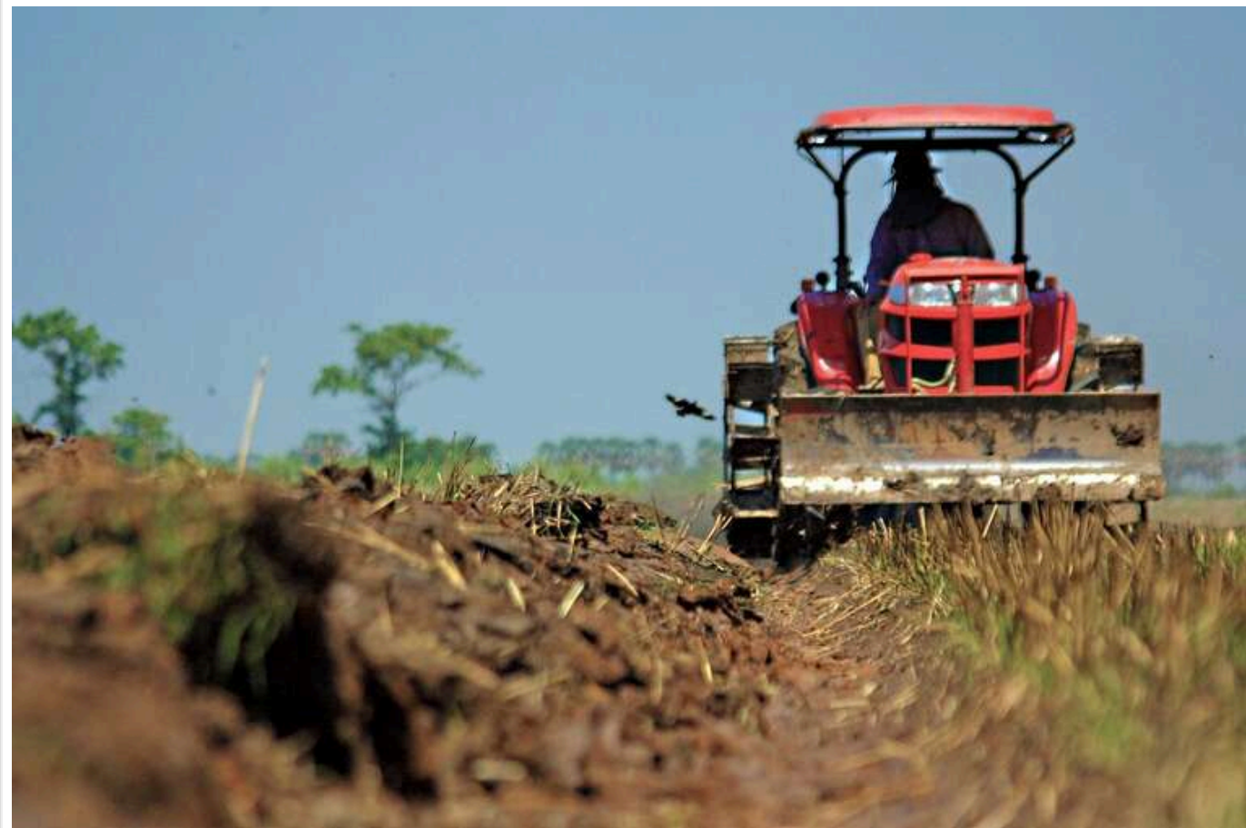
Фермери США розкритикували нові мита на імпорт з Канади, Мексики та Китаю: «Торговельна війна завдасть удару по Америці»

Фермери Сполучених Штатів негативно відреагували на введення нових мит на імпорт з Канади, Мексики та Китаю, заявивши, що це може завдати серйозного удару по американським аграрним виробникам.