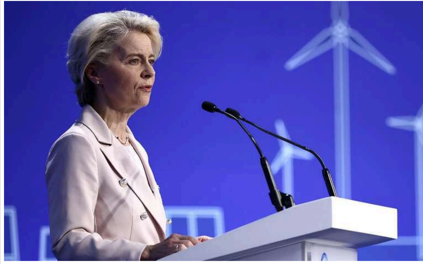
Фон дер Ляєн представила план переозброєння ЄС на 800 мільярдів євро

Глава Єврокомісії Урсула фон дер Ляєн презентувала план озброєння Євросоюзу на суму 800 млрд євро.