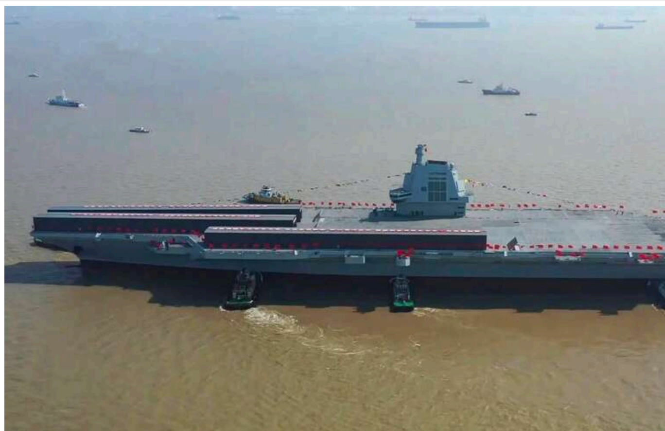
Китай продовжує збільшувати військовий бюджет: не перевищує навіть 2% від ВВП

З 2023 року Китай продовжує щорічно збільшувати оборонні витрати на 7,2%, і цього року його оборонний бюджет становитиме 1,78 трлн юанів (приблизно 245 млрд доларів), про що було оголошено на Всекитайському зборі представників 14-го скликання (аналог З'їзду КПРС у СРСР).