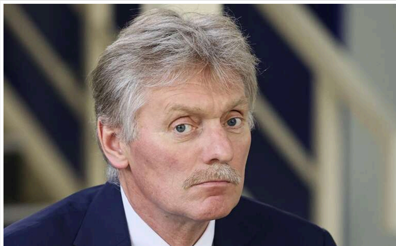
У Кремлі оцінили готовність Зеленського до переговорів

Песков зазначив, що Кремль "позитивно сприймає готовність Зеленського" розпочати переговори, "однак існує перешкода у вигляді його заборони на переговори з Москвою".