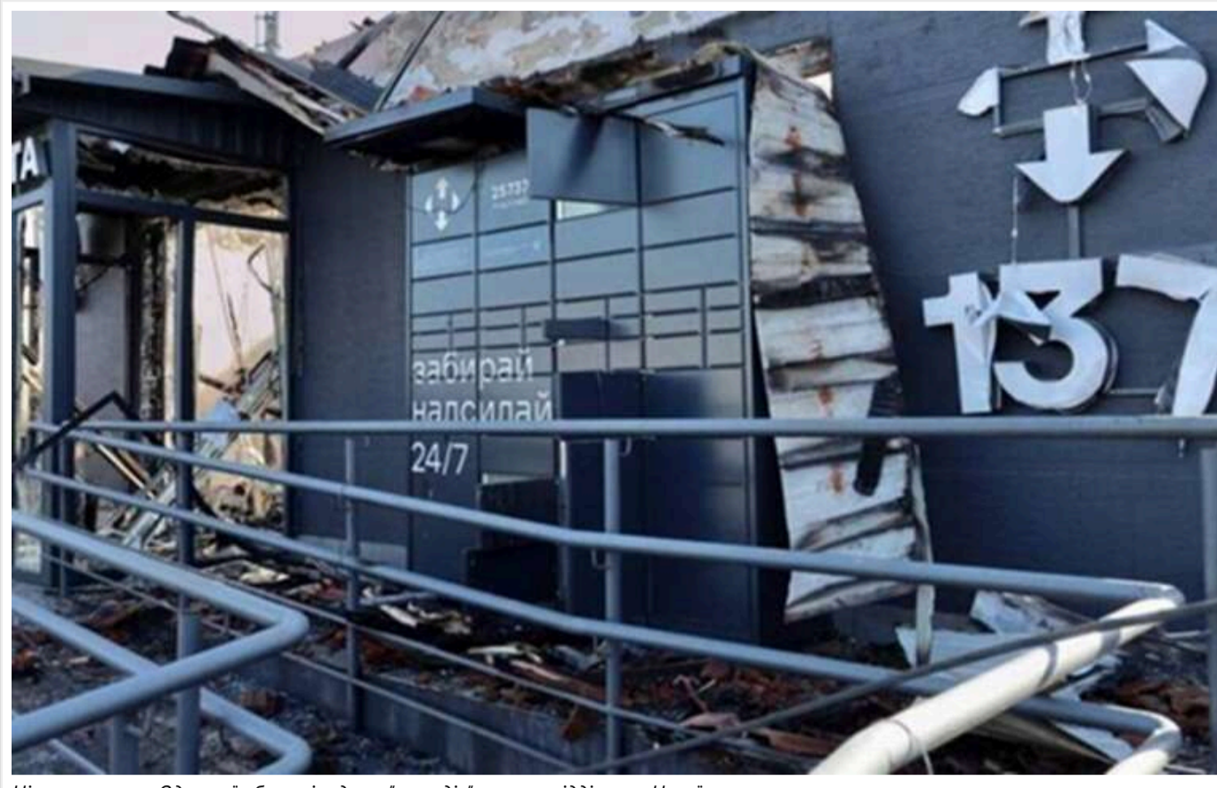
Нічна атака по Одеській області: один з "шахедів" знищив відділення Нової пошти

4 березня в результаті атаки Росії було знищено відділення "Нової пошти" в Одеській області. Згоріло 606 посилок, загальна оголошена вартість яких перевищує 1 млн грн.