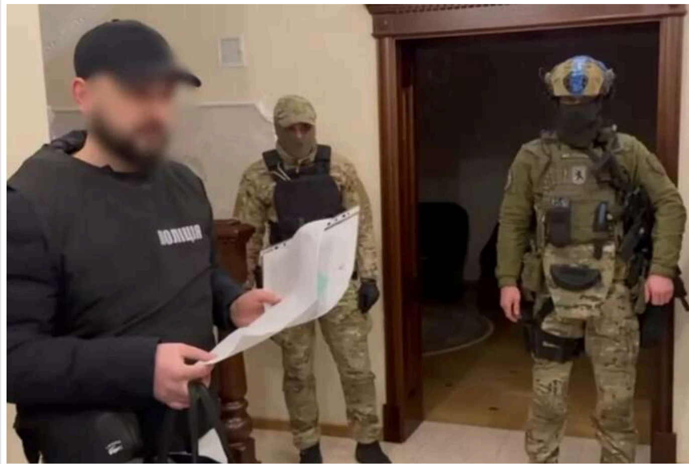
На Львівщині працівники банку привласнювали кошти клієнтів: з рахунків громадян зникло понад 5 мільйонів гривень

На Львівщині завершили досудове розслідування у справі організованої злочинної групи банкірів, які впродовж 2023-2024 років незаконно заволодівали коштами клієнтів. Згідно з інформацією кіберполіції, працівники банку отримували несанкціонований доступ до рахунків громадян, які, ймовірно, залишилися на тимчасово окупованих територіях.