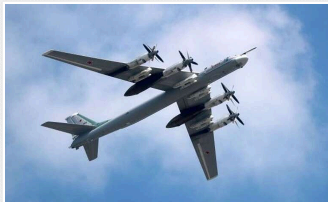
Ракетна загроза: 12 ТУ-95МС готові до ракетної атаки

Близько 12 ТУ-95МС готові до ракетного удару, кожен борт оснащений 4 ракетами, що дає загальний залп у 48 ракет, – монітори.