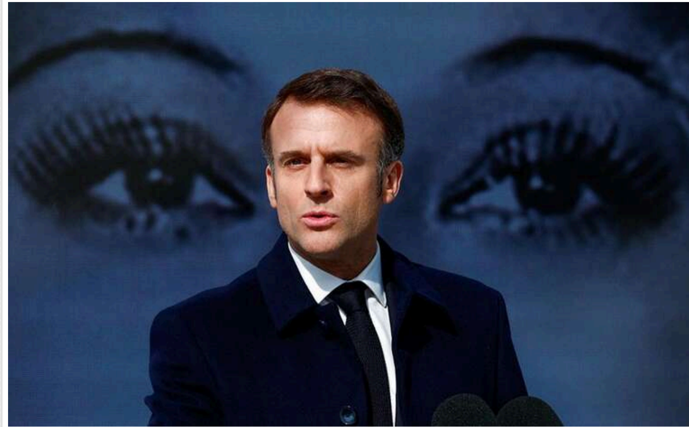
Макрон анонував важливе звернення до нації

Сьогодні ввечері Макрон звернеться до нації з питань світових проблем.