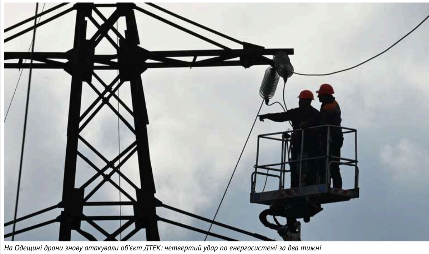
На Одещині дрони знову атакували об'єкт ДТЕК: четвертий удар по енергосистемі за два тижні

Внаслідок російської атаки ввечері 4 березня в Одеській області знову зазнав пошкоджень енергетичний об'єкт.