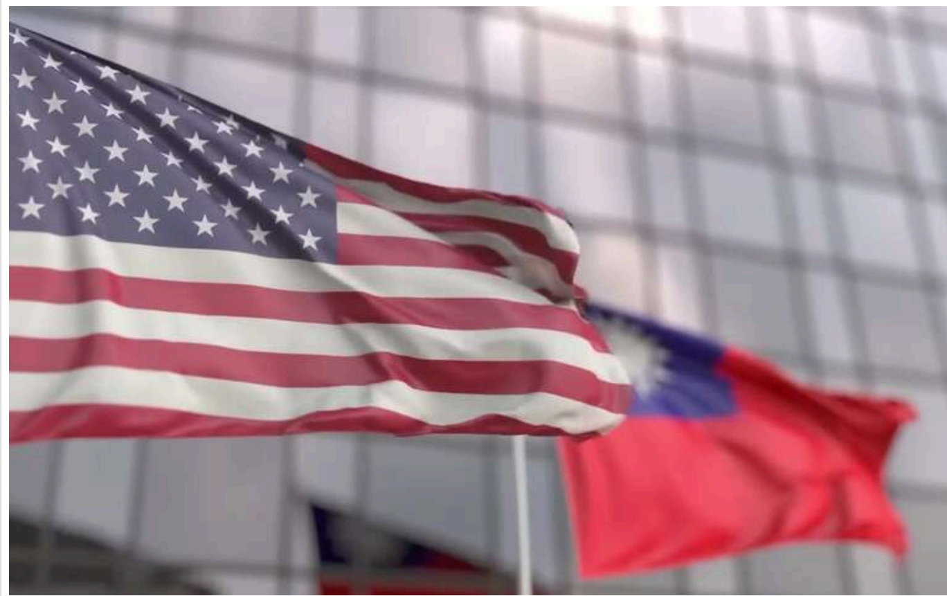
На Тайвані заявили про необхідність перегляду відносин зі США

Bloomberg: Розбіжності між Трампом і Зеленським змушують Тайвань переглянути відносини зі США.