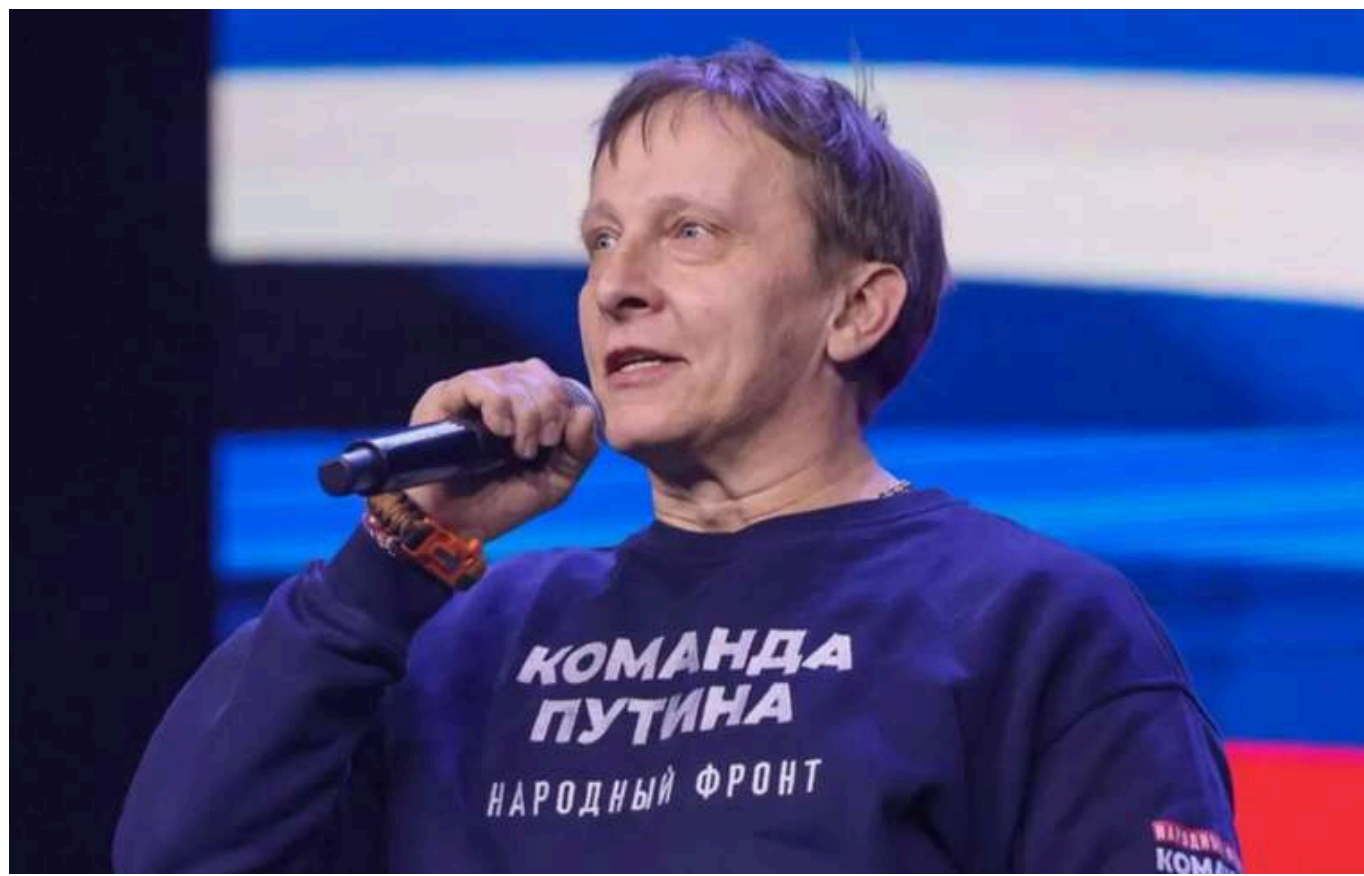
Зірка "Інтернів" Охлобистін отримав заочну підозру за пропаганду війни проти України

Служба безпеки України заочно повідомила про підозру скандальному російському актору, зірці серіалу "Інтерни", Івану Охлобистіну, який відверто підтримує кривавий режим Кремля. 58-річний прихильник Путіна бере участь у пропагандистських заходах, під час яких агітує за війну РФ проти України та закликає вбивати громадян нашої країни.