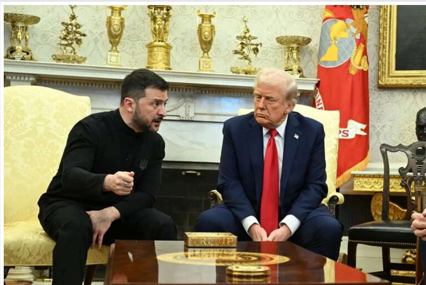
На вечірньому шоу США розібрали "ганебну" сварку Трампа і Зеленського: "Нещасний чоловік, чию країну бомблять, і недоумкувата поліція моди"

Ведучий американського вечірнього ток-шоу Jimmy Kimmel Live – Джиммі Кімміл прокоментував напружену зустріч Володимира Зеленського та Дональда Трампа у Білому домі, протягом якої між лідерами держав розгорілася суперечка. Комік висміяв "підкол" президента США та одного із репортерів у бік українського лідера з приводу того, що він з'явився на офіційній зустрічі без костюма, чим нібито виявив неповагу. За словами артиста, дивно бачити, як під час спілкування із лідером України, який намагається зробити все, аби захистити свою державу від війни, "недоумкувата поліція моди" вирішує обговорити його вбрання.