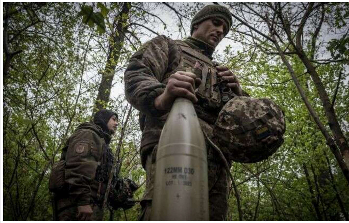
Україна працює над альтернативною системою зв'язку для ЗСУ на випадок відключення Starlink, – The Economist

Україна прагне створити альтернативну систему зв'язку для військових на випадок, якщо США вирішать відключити системи Starlink, які нині використовують ЗСУ, – повідомляє The Economist з посиланням на українського чиновника.