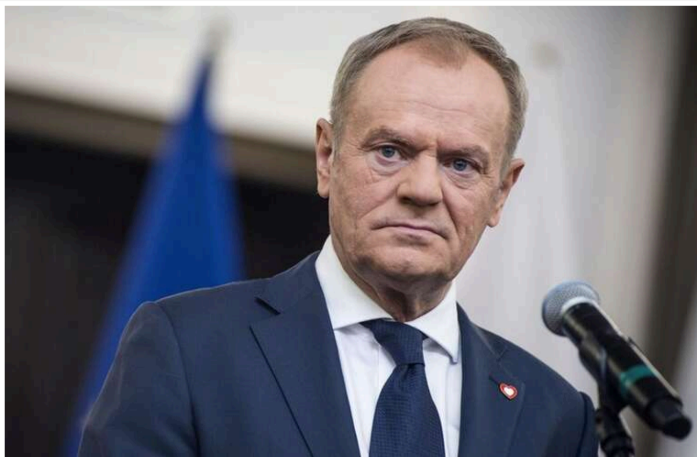
Туск: США можуть скасовувати санкції проти РФ

США можуть розпочати скасування санкцій щодо РФ, повідомив прем'єр-міністр Польщі.