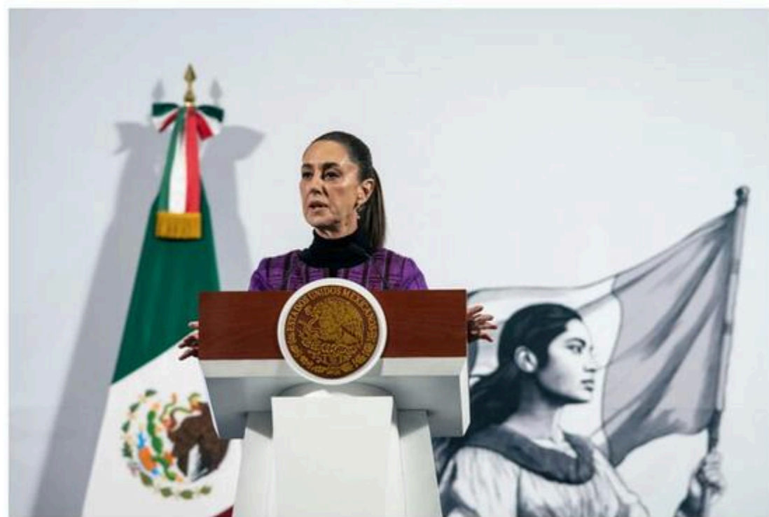
Claudia Sheinbaum