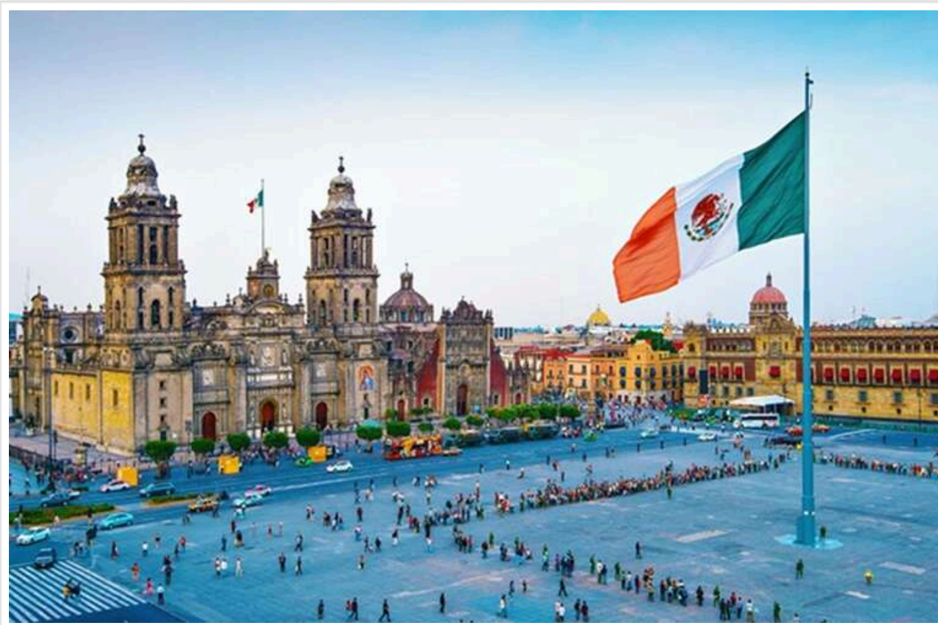
Мексика оголосить про тарифи у відповідь та інші заходи проти США, - Bloomberg

Президент Мексики заявила, що в неділю оголосить про введення відповідних тарифів та інших заходів проти США у відповідь на введення Трампом 25-відсоткових мит, повідомляє Bloomberg.