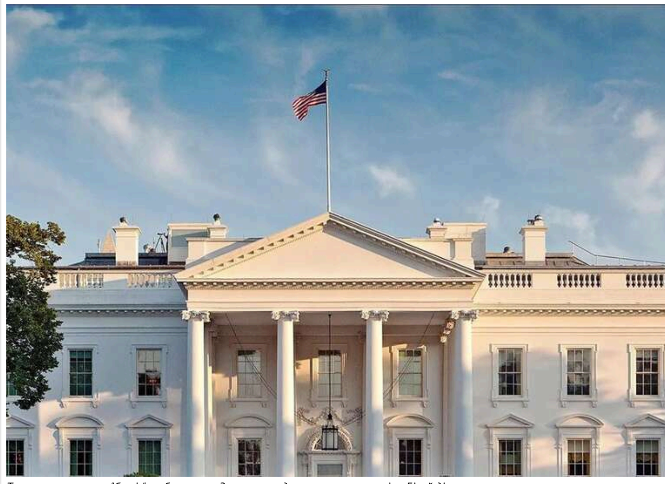
Трамп використовує "батіг", щоб схилити Зеленського до мирних переговорів, - Білий дім

У Білому домі підтвердили припинення військової допомоги Україні.