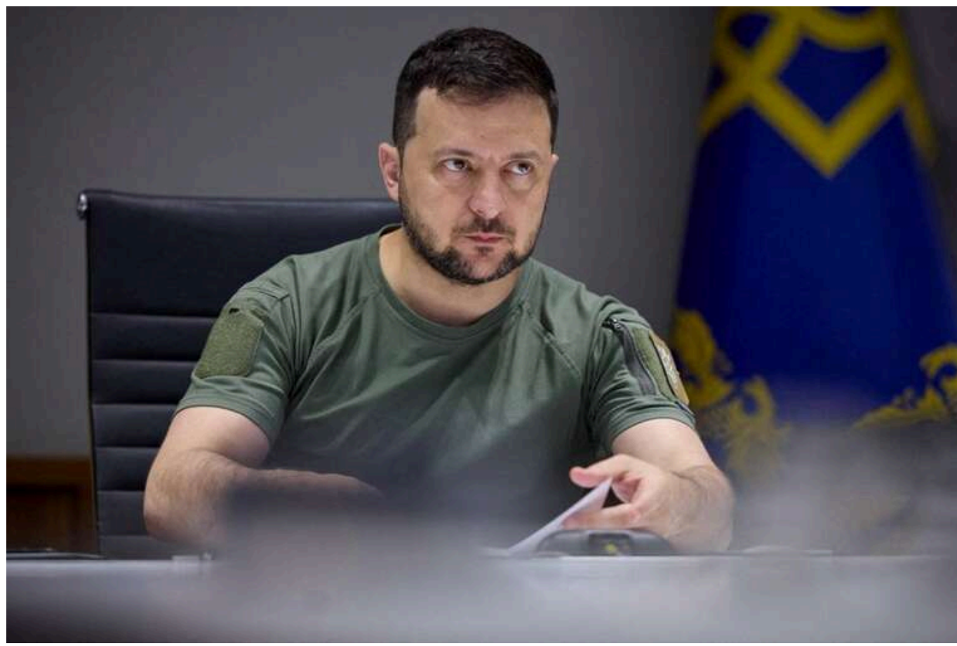
Político: США намагаються змусити Зеленського пом'якшити риторику на адресу Путіна

Адміністрація президента США Дональда Трампа все ще вірить у можливість швидкого завершення війни в Україні та має намір схилити президента України до пом'якшення його позиції щодо країни-агресорки Росії.