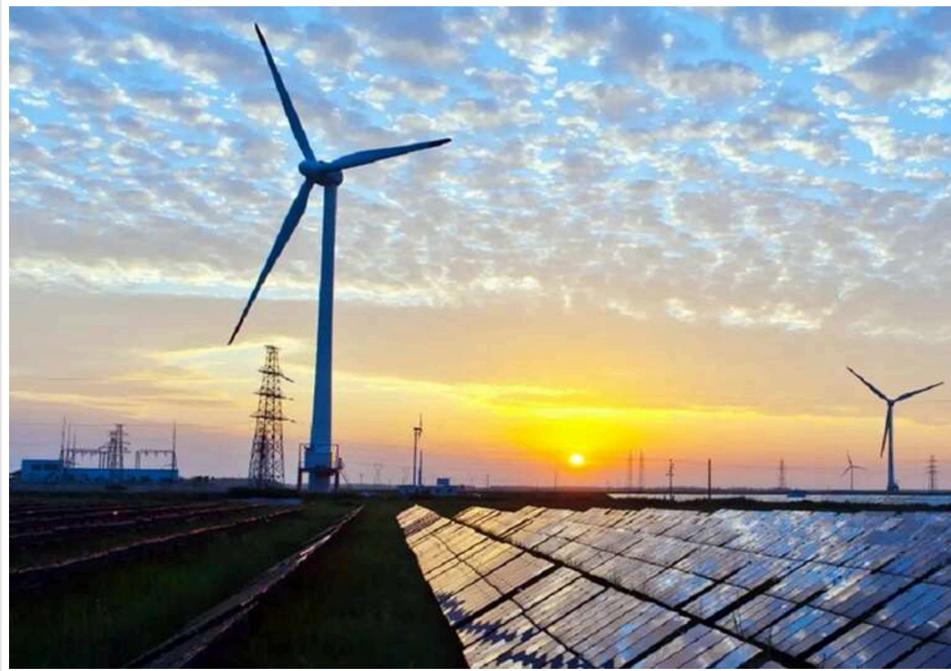
Ціни на електроенергію в Європі опускаються нижче нуля, - Bloomberg

У деяких європейських країнах, таких як Німеччина, Нідерланди та Бельгія, ціни на електроенергію стали від'ємними, що викликало радість серед споживачів і занепокоєння у працівників енергетичного сектору.