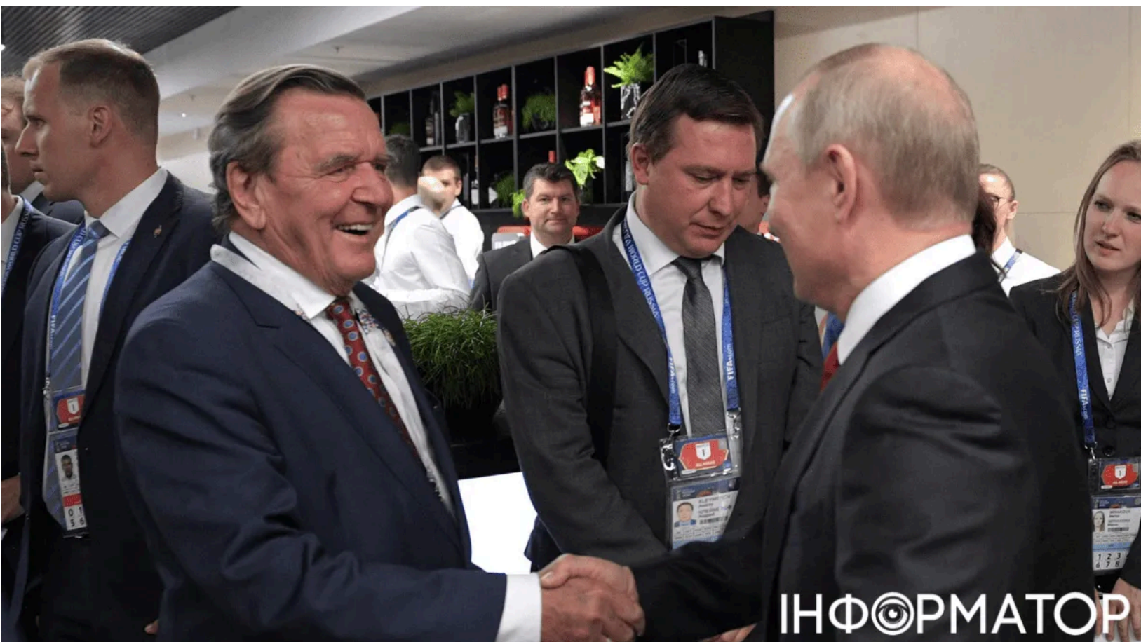
Шредер у Москві напередодні Петербурзького форуму.

Колишній канцлер Німеччини Герхард Шредер перебуває в Москві. Мета його нинішнього візиту наразі невідома - він збігається з початком Петербурзького міжнародного економічного форуму. Раніше глава МЗС України Андрій Сибіга різко відкинув ідею призначення Шредера переговорником між ЄС та РФ . Берлін також поставився до ініціативи Кремля скептично.