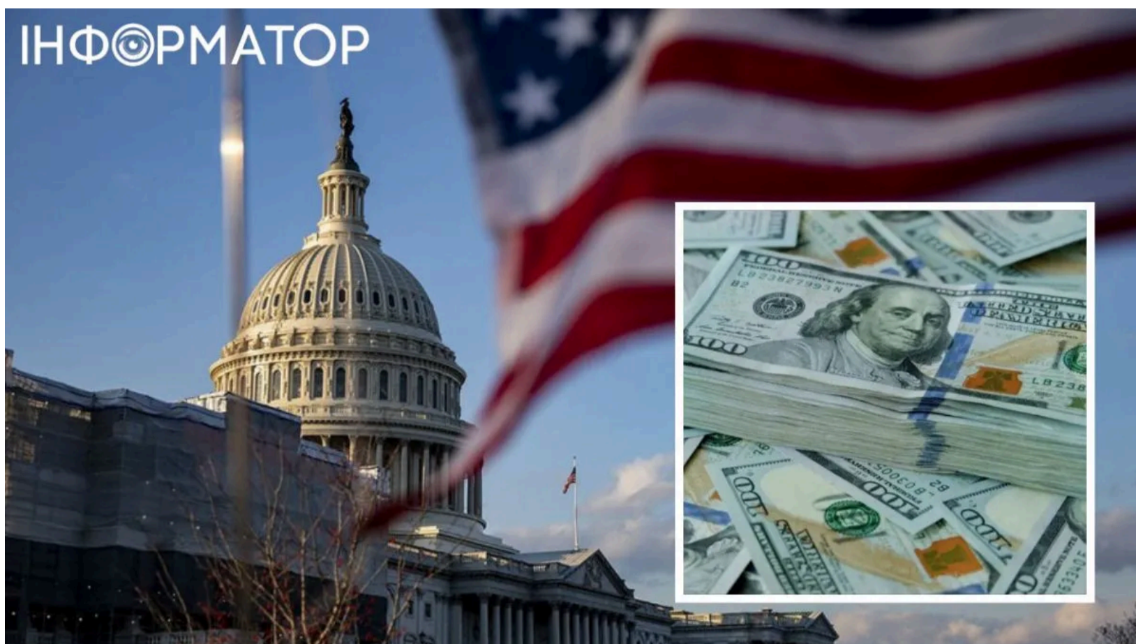
$400 млн США для України - чому це в

Державний секретар США Марко Рубіо заявив, що незабаром з'являться новини щодо 400 мільйонів доларів військової допомоги Україні - кошти, затвержені Конгресом, але місяцями заблоковані всередині Пентагону. Сума виглядає скромно на тлі попередніх пакетів, але природа цього фінансування робить його стратегічно важливим - і вона принципово відрізняється від того, що багато хто в Україні помилково називає "ленд-лізом". Щоб зрозуміти чому - варто розібратися, що саме стоїть за цими грошима.