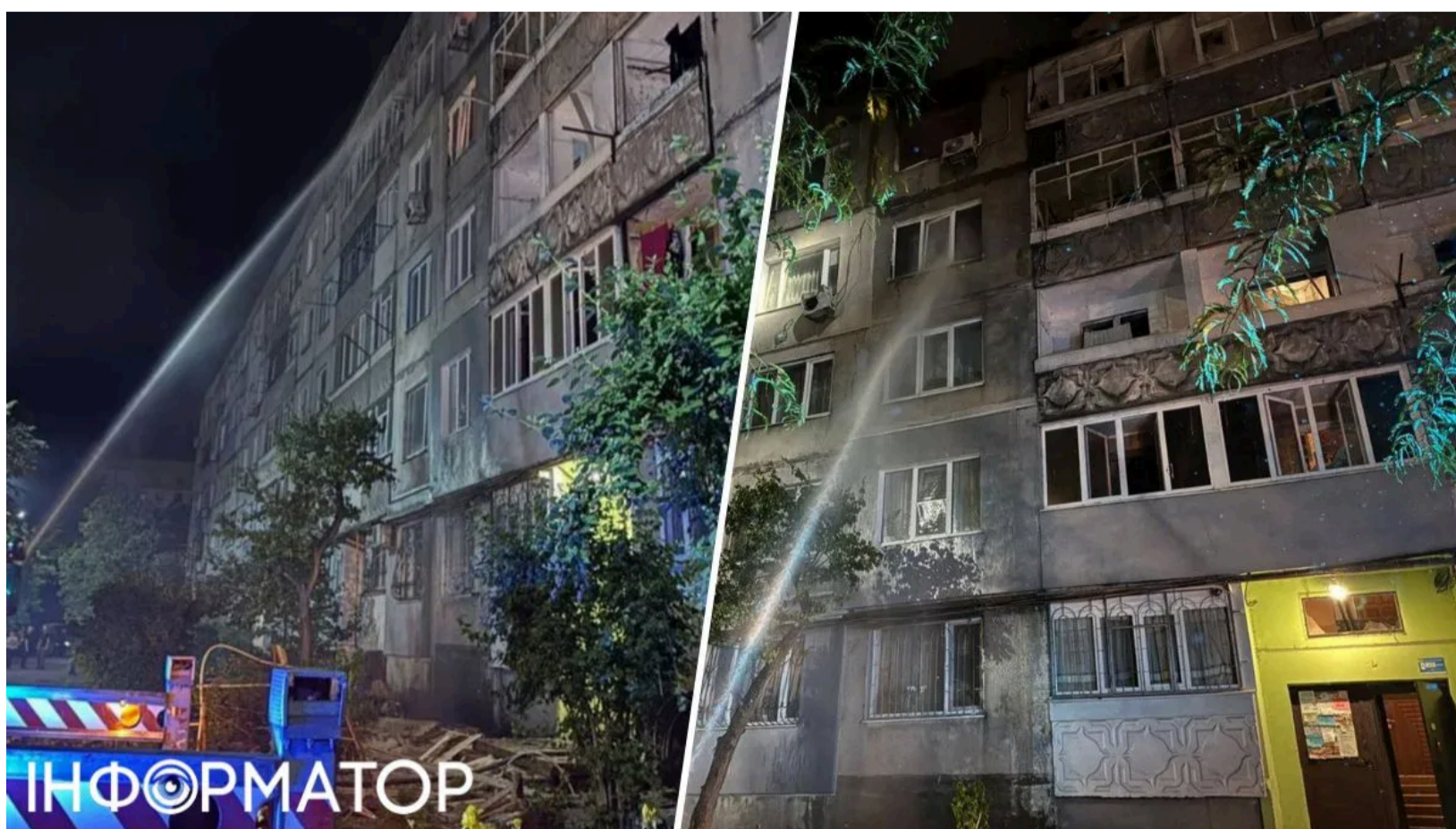
Росія вдарила по Павлограду – є постраждалі

Вранці 4 червня Росія атакувала відразу п'ять районів Дніпропетровської області – безпілотниками, артилерією та авіабомбами. Удари по Дніпропетровській області тривають вже кілька днів поспіль: напередодні ворог атакував склади торговельної мережі та логістичну компанію, поранивши шістьох людей. Цього разу найбільше дісталось Павлограду в Павлоградському районі – двоє мирних жителів отримали поранення. Загалом зафіксовано понад 20 атак по різних населених пунктах.