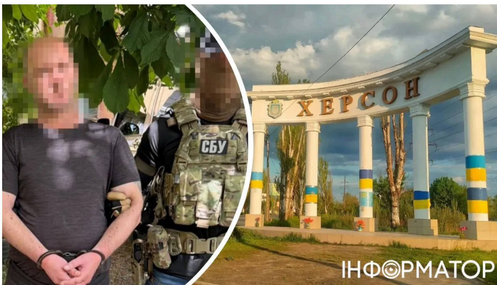
Пособник РФ із Херсонщини отримав підозру за держзраду

Колишній працівник воєнізованої охорони залізниці, який під час захоплення Херсона супроводжував ешелони РФ зі зброєю та боєприпасами для передової, опинився за ґратами . Чоловіка спіймали наприкінці травня 2026 року після тривалих розшукових заходів. Раніше, ще у 2025 році, йому заочно оголосили підозру.