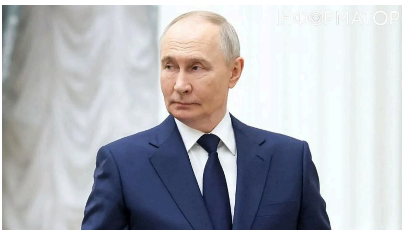
Британія і дві країни ЄС розробили план переговорів з Путіним

Великобританія, Франція та Німеччина спільно з Києвом розробляють план залучення Росії до мирних переговорів для припинення війни. Переговори під керівництвом США зайшли в глухий кут , а на фронті фактично склався позиційний тупик - саме тому три країни побачили шанс примусити Путіна сісти за стіл переговорів. Якщо переговори розпочнуться зараз, союзники розраховують завершити війну до зими 2026-2027 років і не допустити нових масованих ударів по українській енергетичній інфраструктурі та мирному населенню. При цьому остаточне рішення про те, чи продовжувати спроби переговорів з Росією, залишається за президентом Зеленським - тиску на нього з боку партнерів не буде.