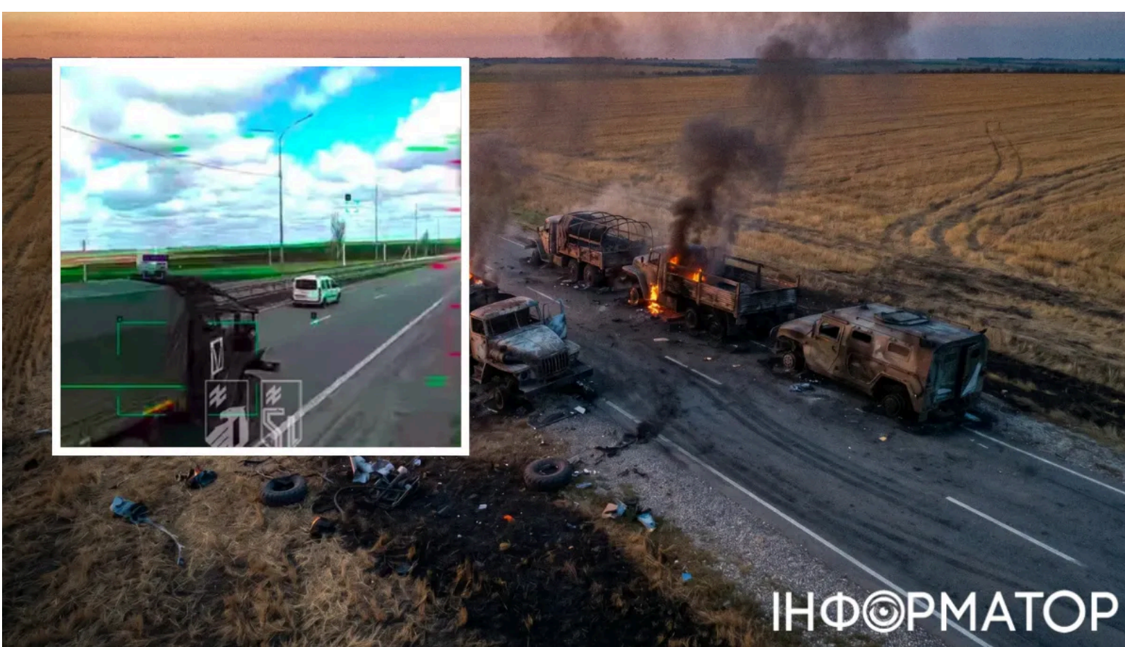
Російська логістика в Горлівці винищується.

Сили оборони України взяли під вогневий контроль тимчасово окуповану Горлівку в Донецькій області. Логістика росіян в цьому місті потерпає від постійних дронівих ударів. Все, що намагається заїхати до Горлівки, потрапляє під атаку.