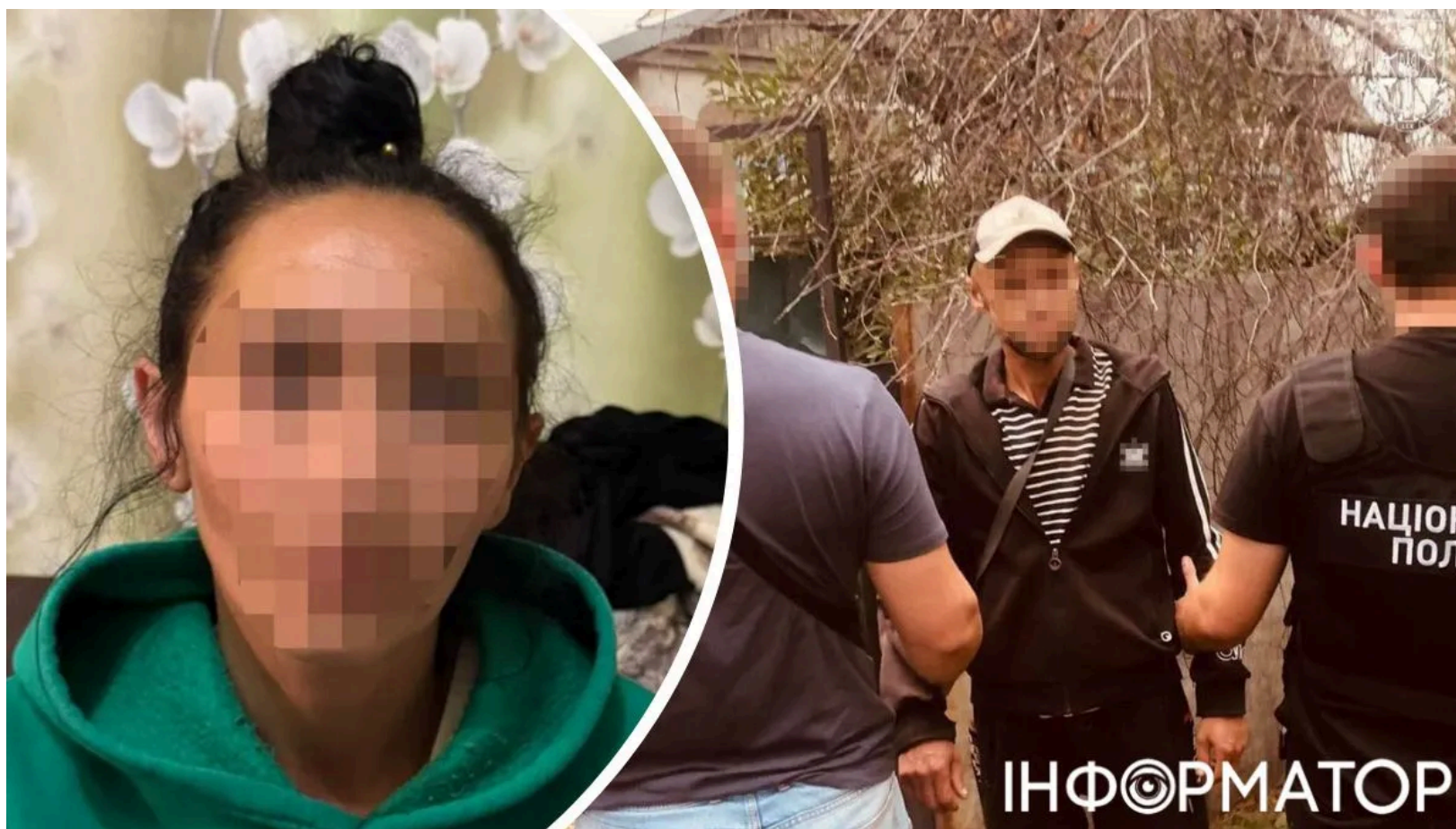
Збувачів метадону на Донеччині засуджено до 8 років. Колаж: Інформатор

Суд на Донеччині виніс вирок п'ятьом членам організованої групи, яка постачала метадон із Миколаївської області та збувала його через закладки у Слов'янську і Олександрівській громаді. Нещодавно на Київщині викрили збувачів метадону на дому - там теж фігурують кілька підозрюваних і факти реалізації наркотика знайомим. Кожному з п'яти засуджених призначено по 8 років позбавлення волі з конфіскацією майна - за ч. 3 ст. 307 Кримінального кодексу України. Щомісячний оборот групи сягав від 500 тисяч до 1 мільйона гривень.