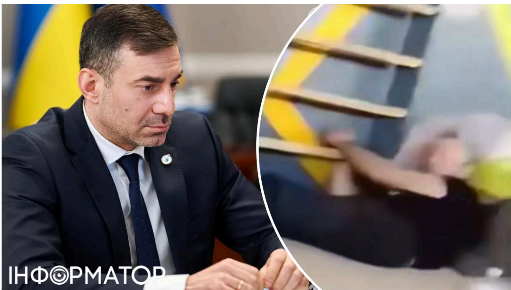
Катування в Ужгородському РТЦК - підозри оголошено.

Працівники Ужгородського районного територіального центру комплектування та соціальної підтримки прив'язували людей кайданками до драбини та застосовували фізичне насильство. 4 червня 2026 року кільком посадовцям було оголошено підозри - результат моніторингового візиту омбудсмена та матеріалів, переданих до правоохоронних органів. Раніше омбудсмен реагував на порушення мобілізаційних заходів , коли поліцейські силоміць затримали чоловіка. Тепер справа дійшла до підозр у катуванні - вперше саме щодо Ужгородського РТЦК та СП.