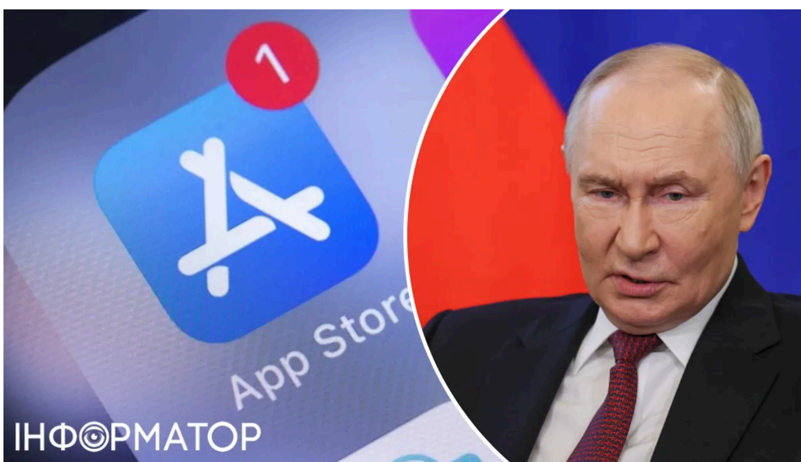
Понад 20 мільйонів росіян втратили доступ.

Компанія Apple прибрала з App Store російський державний месенджер МАХ - головний цифровий інструмент стеження Кремля за росіянами. Раніше Росія вже намагалась відключити Telegram , аби пересадити громадян на підконтрольний застосунок, - і тепер цей план дав серйозну тріщину. Глава Мінцифри Росії Максут Шадаєв заявив, що видалення зачепило 25-30% користувачів сервісу, або понад 20 млн росіян. Apple жодних пояснень Москві не надала.