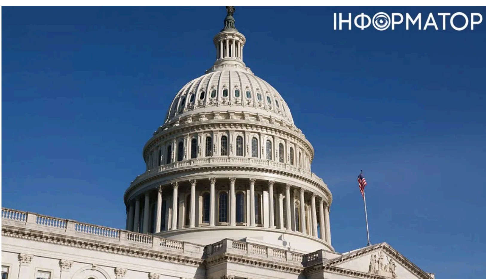
Конгрес США ухвалив закон про допомогу Україні.

Палата представників США ухвалила законопроект Ukraine Support Act, який передбачає понад мільярд доларів прямої допомоги Україні та жорсткі санкції проти Росії. Нові санкції проти РФ Вашингтон обговорював ще навесні - тоді акції "Газпрому" обвалились на 7% лише на чутках про можливі обмеження. Тепер нижня палата Конгресу зробила перший реальний крок - попри відкритий спротив керівництва Республіканської партії. Але закон навряд чи переживе голосування в Сенаті.