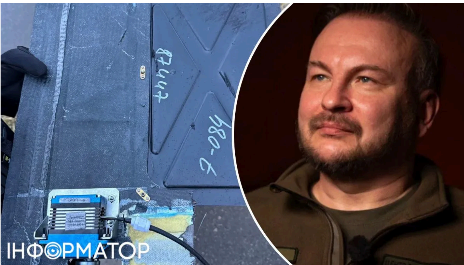
Шахеди летять в Україну прямо з конвеєра