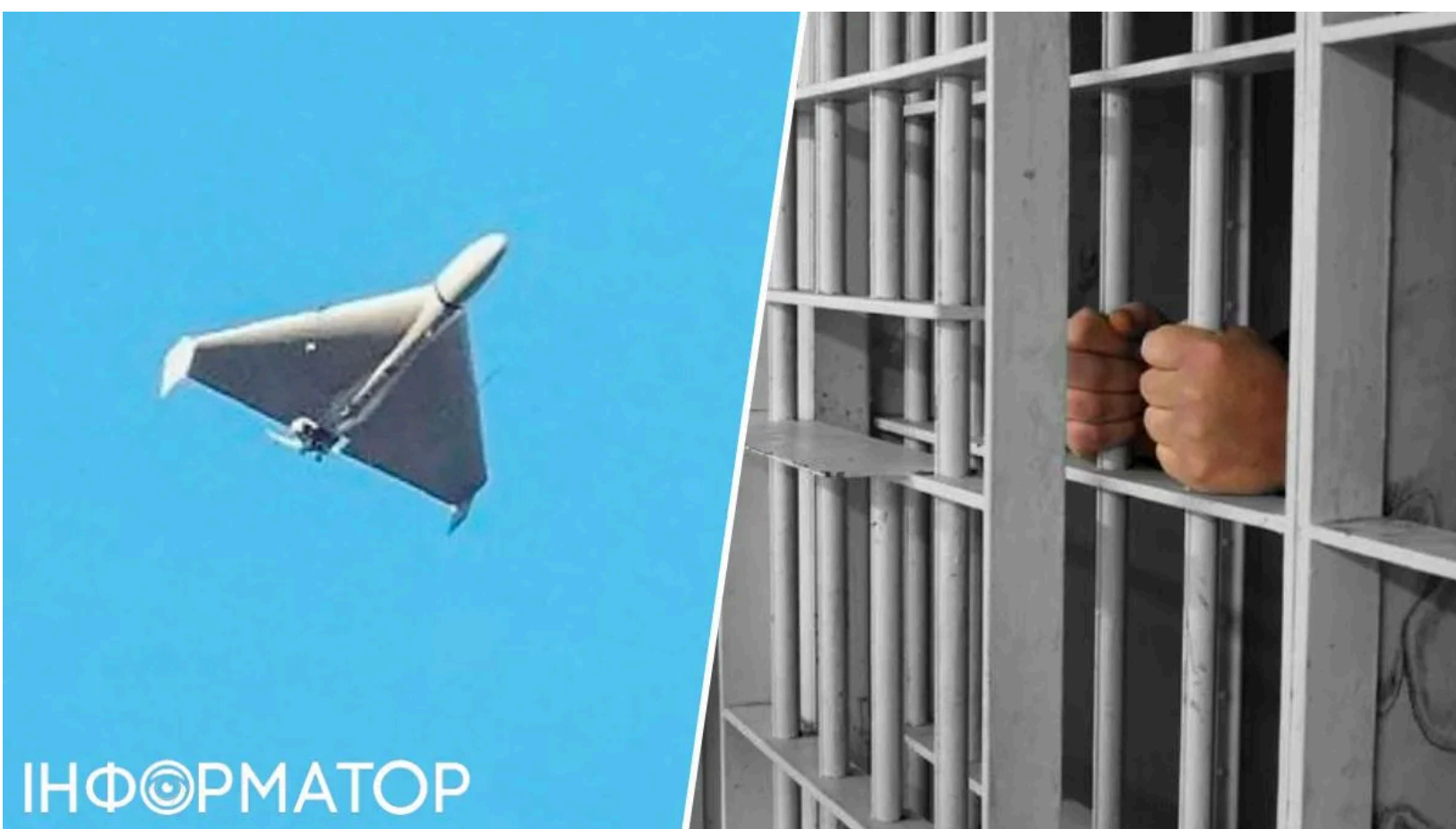
Завербований військовослужбовець розраховував на удар безпілотною по ізолятору

Завербований ФСБ мобілізований збирав розвідані про елітний підрозділ ЗСУ у Запоріжжі - і навіть після затримання не відмовився від співпраці з ворогом. Він розраховував, що зв'язок із куратором допоможе організувати удар безпілотною по ізолятору та відкрити шлях до втечі. Контррозвідники СБУ викрили і перший, і другий задуми, не давши жодному з них реалізуватися.