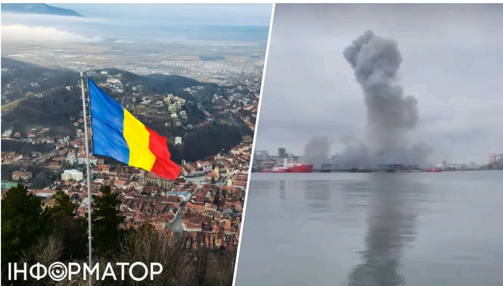
Дрон вибухнув у порту Констанца

Морський безпілотної літачки вибухнув вранці 5 червня у порту Констанца - одному з найбільших портів Чорного моря. Румунія вже закривала консульство РФ після аналогічного резонансного інциденту з безпілотної літачки. Влада оголосила евакуацію прибережної зони та активувала найвищий протокол надзвичайного реагування.