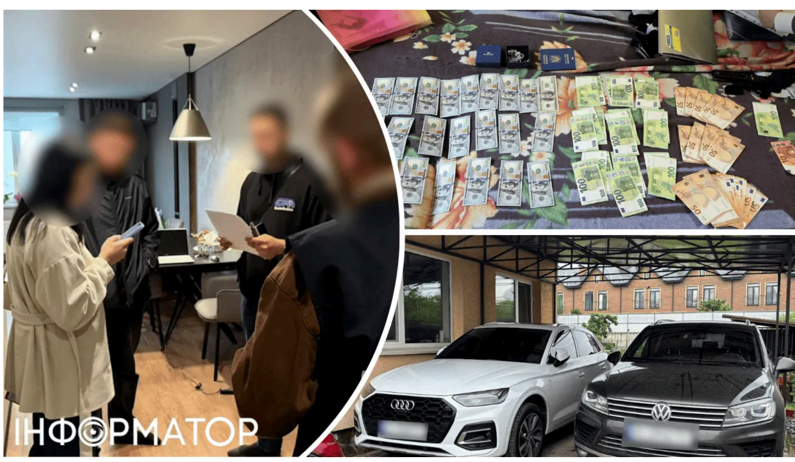
Поліція провела 58 обшуків у ВЛК.

Нацполіція одночасно провела майже 60 обшуків у членів військово-лікарських комісій та експертних команд з оцінювання повсякденного функціонування особи по всій Україні. Масштабну операцію проти посадовців мобілізаційної системи Інформатор описував раніше - тоді під удар потрапили керівники ТЦК, а вилучені активи свідчили про системне незаконне збагачення. Нова операція під умовною назвою "Ескулап" б'є вже по медичній ланці призовного механізму - лікарях і членах комісій, що приймають рішення про придатність до служби. За попередніми даними, загальна сума виявлених недостовірних відомостей у деклараціях посадових осіб сягає 200 млн грн.