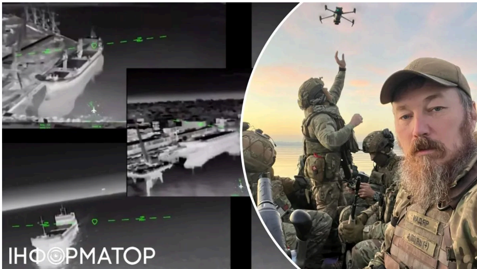
Сили безпілотних систем уразили п'ять суден окупантів у портах

Сили безпілотних систем України за одну ніч уразили п'ять суден на тимчасово окупованих територіях. Українські удари по об'єктах РФ стали системною відповіддю на дії окупантів. Цього разу під прицілом опинилися порти Маріуполя та Бердянська, а також прибережні води ТОТ. Серед цілей - суховантажні судна й танкер, які нелегально перевозили вантажі для ворога.