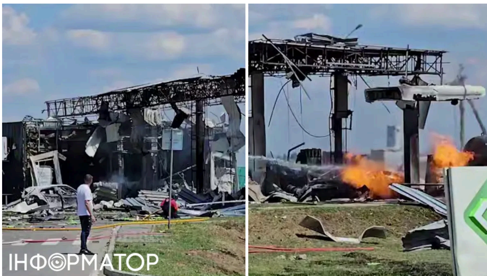
Під удар попало місце, де зупиняються цивільні.

Російські окупанти 5 червня завдали удару по автозаправній станції у Чорнобаївській громаді на Херсонщині. Атаки на мирних мешканців регіону тривають попри відсутність будь-якої військової цілі. За попередніми даними, загинула 35-річна жінка, ще семеро людей отримали поранення.