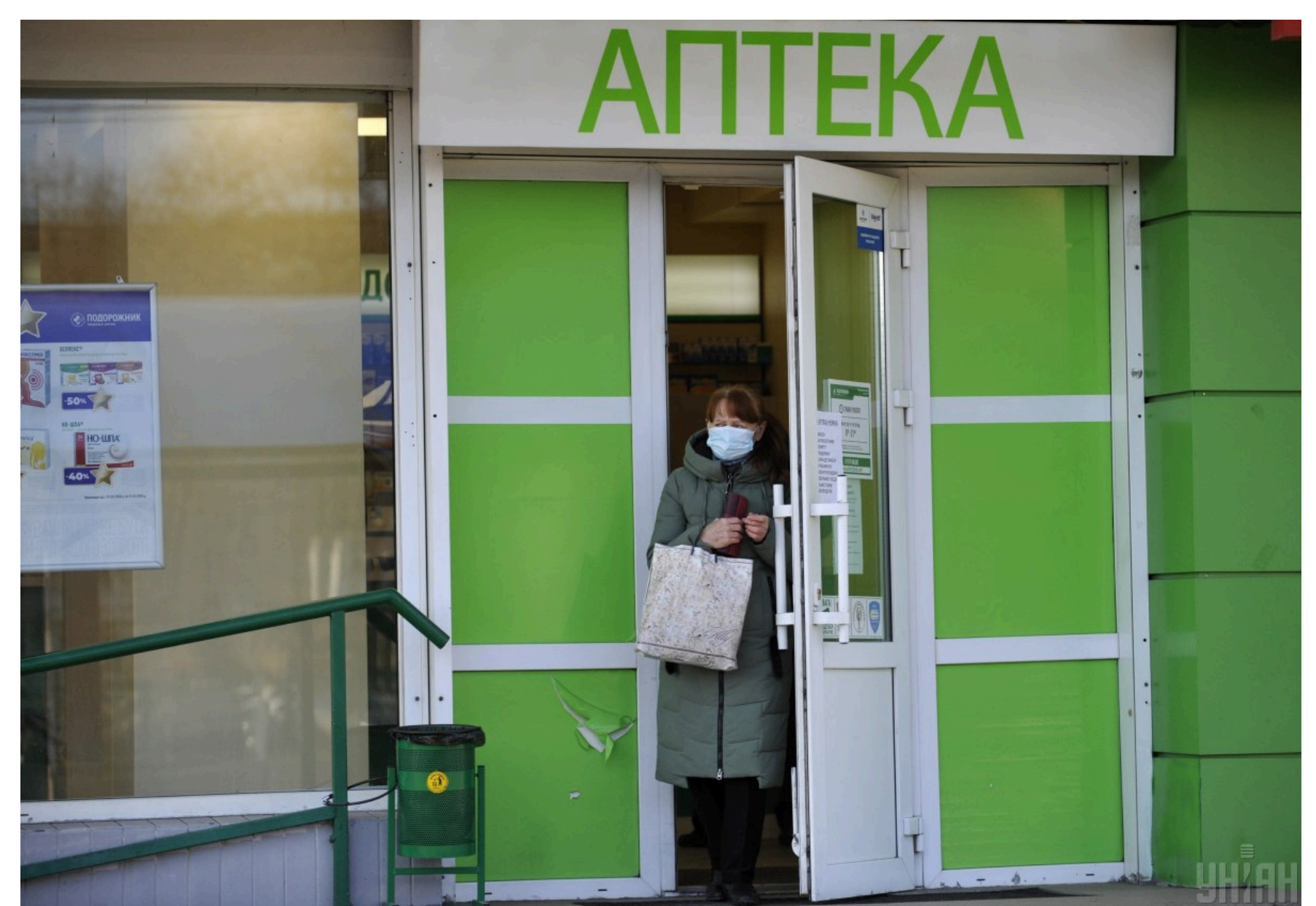
У більшості аптек підтверджують: градусників або ні, або лише електронні та дорогі.

- Конкретні препарати призначає лікар – це противірусні ліки або антибіотики. Препаратів від коронавірусу не існує. Люди беруть те, що звикли, - зауважила наша співрозмовниця.