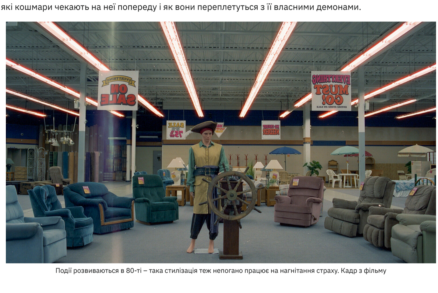
Події розвиваються в 80-ті – така стилізація теж непогано працює на нагнітання страху. Кадр з фільму

Та коли Кларк не з'явився на черговий сеанс, а його магазин виявився закинутим, психотерапевтка вирішує йти за намальованим планом, щоб врятувати клієнта з іншої реальності, навіть не здогадуючись, які кошмари чекають на неї попереду і як вони переплетуться з її власними демонами.